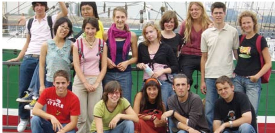
DIE TEILNEHMER AM WORKCAMP 2006

Im Sommer 2006 haben unser Wohnheim-, Jugendhilfe- und Schwerbehindertenbereich gemeinsam mit den Internationalen Jugendgemeinschaftsdiensten (IJGD) ein dreiwöchiges internationales Workcamp veranstaltet.