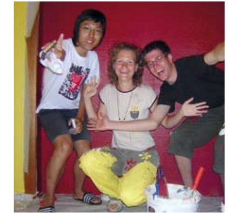
MALERARBEITEN IM SCHIFFERHAUS

An einem Abend luden die Workcamper zum Genuss internationaler Küche ein: Wenn türkisch gekocht, russisch gebacken und koreanisch am Herd gezauert wird, ist dies schon eine spannende