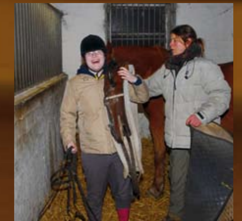
AUCH BEI DER VERSORGUNG DER PONYS PACKEN UNSERE REITER GERNE AN.

Aber eines noch: Bei uns in der Halle sind immer ziemlich viele Leute! Die Kinder und Jugendlichen vom «Ponyhof» verirren sich mal hinein, die «Fitten» aus der Gruppe vorher oder danach sind noch/schon da ... und den Begriff «behindert» – den benutzt hier keiner!