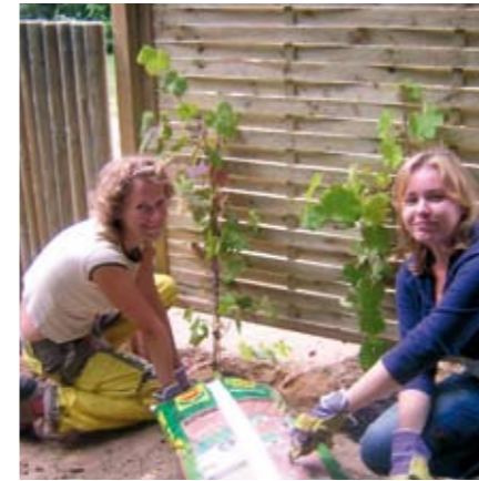
PFLANZARBEITEN BEIM ROSENHOF 1

Auf dem Gelände in Sundsacker entstand ein Grill- und Feuerplatz mit Weidenhütte und Naturzaunelementen. Die Materialbeschaffung war recht einfach, da wir uns nur in der Natur umsehen brauchten und so schnell alles benötigte Strauchwerk, die Pfosten und die Weidenruten beisammen hatten. Einige Kletterpflanzen und das Holz für die Bänke wurden noch gekauft. Da der Boden recht hart war, wurde das Löcherschaufeln in der Sommeronne zur Strapaze, aber geschafft haben wir es dennoch, jeder Weidenrute einen guten Boden zu bereiten. Nun sollten sie nur noch anwachsen. Die Bänke brauchten etwas handwerkliches Geschick, aber auch der Umgang mit der Bohrmaschine kann erlernt werden. Mit einem wetterfesten Anstrich versehen, halten die «Wiesenmöbel» sicher noch einige Jahre. Während der Arbeit gewann ein Ausdruck sehr an Bedeutung: Niveau à bule – die Wasserwaage. Am letzten Abend wurde der neu geschaffene Begegnungs-, Feier- und Feuerplatz eingeweiht und es wurde bis in die Nacht gefeiert. Auch unsere Betreuten waren dabei.