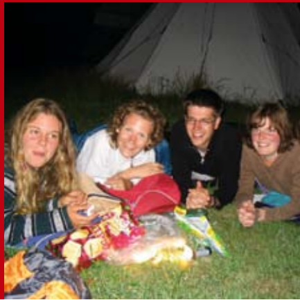
GEMEINSAM ARBEITEN UND SPASS HABEN

Die IJGD sind ein gemeinnütziger Verein und Träger der internationalen Jugendarbeit. Sie veranstalten jährlich ca. 120 internationale Workcamps, die während der Sommermonate in der gesamten BRD stattfinden.