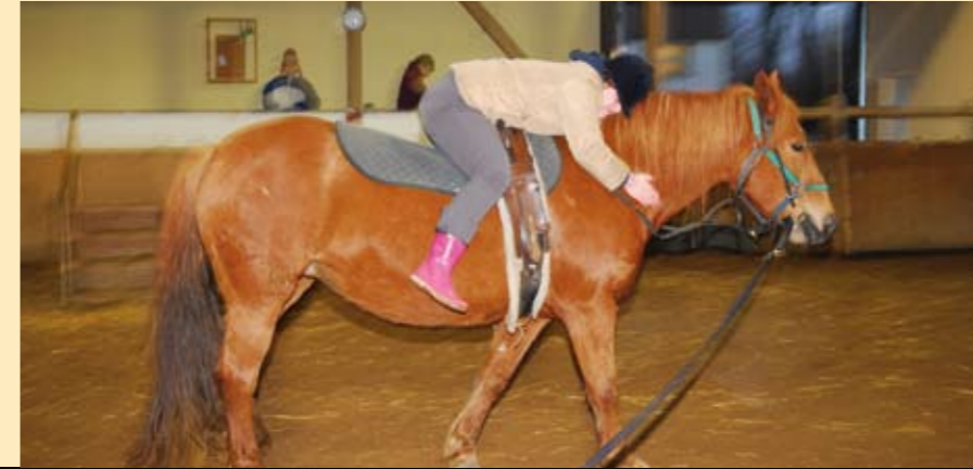
EINE INNIGE VERBINDUNG – ZWISCHEN REITER UND TIER

kann (ein rhythmisches Aufstehen und Hinsetzen in der Gangart Trab), und das geht nun mal am Besten im Sattel. Sie wissen nicht wirklich, dass dabei die Steigbügel hilfreich sind, sie wollen es, «weil es so sein soll – sie sind richtige Reiter!»