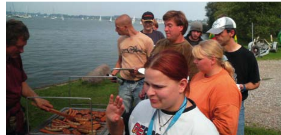
DIE VOM ABW-ORGANISIERTEN AKTIVITÄTEN ERFREUEN SICH GROSSER BELIEBTHEIT

Ideen für Gesprächsgruppen oder tagesstrukturierende Maßnahmen sind entstanden und entstehen ständig wieder neu – kurzum: Die Entwicklung bleibt nicht stehen, sie wird immer rasanter, die Nachfrage nach Unterstützung zur Selbstständigkeit wird immer größer, die Ansprüche der Klienten und damit die Aufgaben für uns als Team immer vielfältiger.